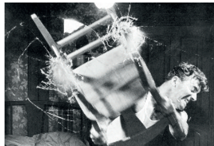
The Killers (1946, Robert Siodmak)

Montag, 13.11.2017, 10–12 Uhr Ab 15 Jahren