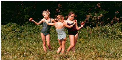
Wald der Echos (2016, Maria Luz Olivares Capelle)

Montag, 9.10.2017, 10–12.30 Uhr Ab 15 Jahren