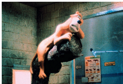
Creature Comforts (1989, Nick Park)

Mittwoch, 13.12.2017, 9.30–11.30 Uhr 8–11 Jahre