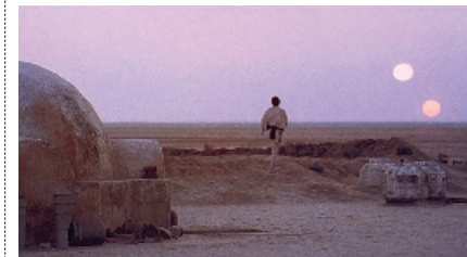
Star Wars (1977, George Lucas)

Donnerstag, 18.1.2018, 10–12 Uhr 13–17 Jahre