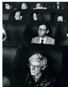
Andy Warhol, 1970 im Invisible Cinema, New York

Donnerstag, 19.10.2017, 10–12 Uhr Ab 15 Jahren